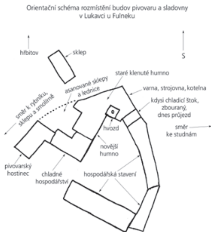
Obr. 7 Skica – Stavebně-technologické uspořádání pivovaru, které vychází z terénního výzkumu autora a není podloženo žádným inventářem či stavebními plány (nákras autor).