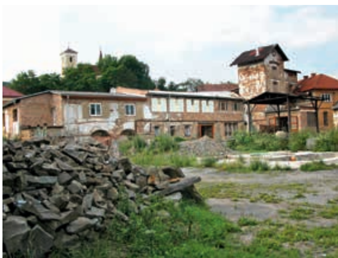
Obr. 8 Pohled do pomalu rekonstruovaného dvora bývalého lukaveckého pivovaru se stále dominantním sladovnickým hvozdem a kostelíčkem se hřbitovem v pozadí, 2005.

Rozvoz piva probíhal koňským povozem a posledním kočím byl jistý Šimečka. Ten si dřevěné transportní sudy přikrýval větvemi před