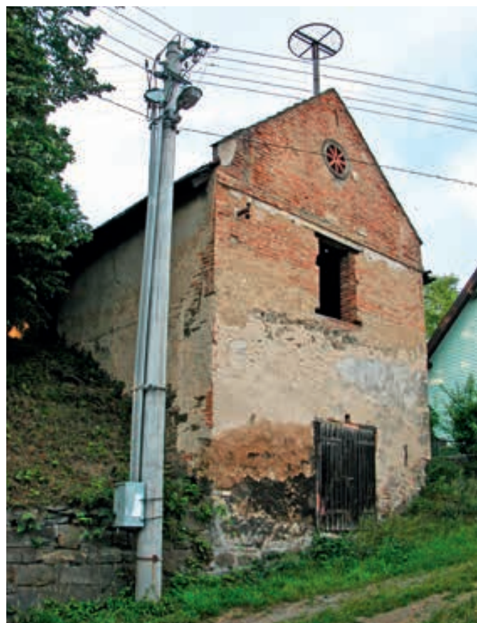
Obr. 9 Sklep s lednicí, který byl vystavěn ještě před přechodem na spodní kvašení, stával naproti pivovaru přes cestu směrem ke hřbitovu. Před několika lety byl zbourán, 2005.