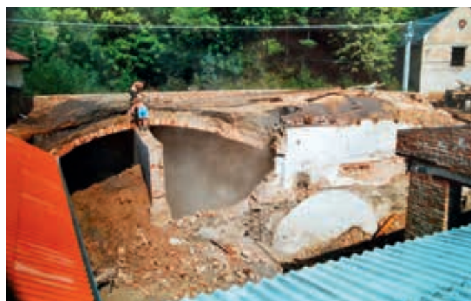
Obr. 10 Demolice sklepů a lednic, v pozadí vpravo budova dalšího chladného hospodářství, nedatováno (David, 2012).