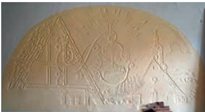
Obr. 5 Ryze německý pivovarský motiv v bývalé pivovarské restauraci, 2012.

v závěsu za pivovary ve Fulneku a v Bílovci, ale před sousedními pivovary v Odrách a Příboru. Produkce pivovaru zahrnovala 97% výčepního piva, 3% ležáku a před první světovou válkou se dokonce svařovalo speciální bavorské pivo. Tento speciál se vařil jistě i nadále, neboť místní pamětníci vzpomínají speciální tmavou šestnáctku a ze srovnání výše popsané charakteristiky a německé oblasti můžeme předpokládat spíše německý doublebock než český speciál (David, 2012).