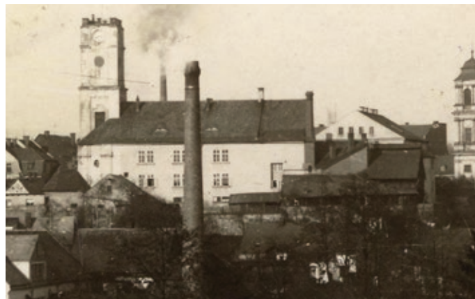
Obr. 9 Celkový pohled na jablonský pivovar od jihu cca 1930, zleva barokní kostelní věž upravená na hvozdu, sladovna oddělená od varny protipožární příčkou, komín ze strojovny, budova chladného hospodářství a chladicí štoky

Manuscript received / Do redakce došlo: 05/06/2018 Accepted for publication / Přijato k publikování: 10/08/2018