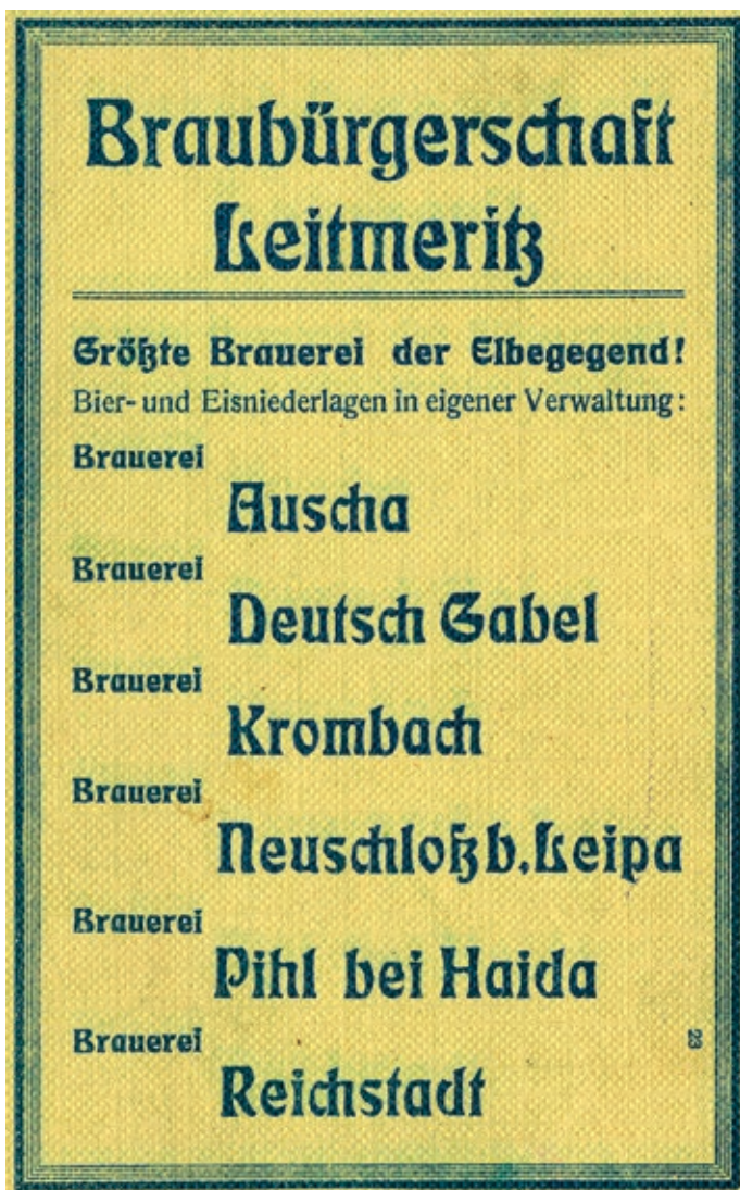
Obr. 7 Reklama na sklady litoměřického měšťanského piva umístěné většinou v uzavřených konkurenčních pivovarech

Po skončení válečného konfliktu se pivovar v nově vzniklém Československu jen pomalu navracel do předválečného stavu a roční výstavy se pohybovaly zhruba na polovině předválečných maxim v rozmezí 5000–6000 hektolitřů. V roce 1925 vařilo v Čechách celkem 447 pivovarů, z toho 27 jich bylo ve stejné velikostní struktuře 5000–6000 hl jako v Jablonném, 212 pivovarů bylo menších a 9 pivovarů vystavovalo více než 100 000 hl. Na počátku 20. let 20. století byl, dle informací z Compassu, nebo ze sborníků Československého průmyslu a obchodu, jablonský pivovar parostrojní a vybaven parním strojem o výkonu 8 HP (Hanel, 1912 a Franzl, 1923). Tato informace nám vnáší další pochybnost ohledně technologického vybavení pivovaru, když na počátku 20. století bylo uváděno 60 HP. Jeden z těchto zdrojů je bohužel lichý.