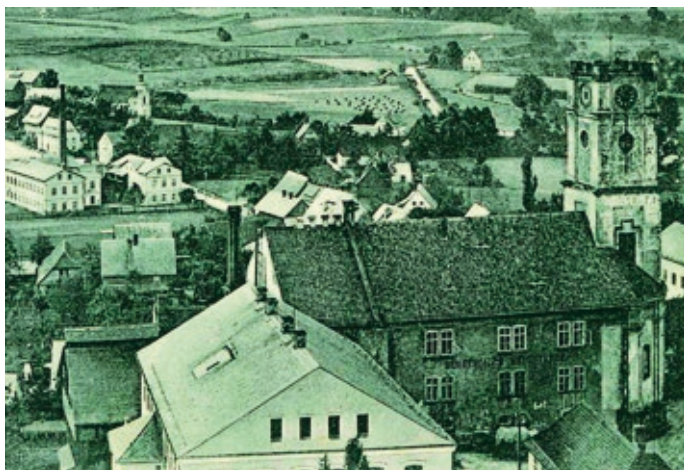
Obr. 8 Celkový pohled na jablonský pivovar od severu ze Školní ulice cca 1910, zleva chladicí štoky se střešním párníkem, komín ze strojovny, varna se sérií párníků a komínem varny, sladovna oddělená od varny protipožární příčkou a barokní kostelní věž adaptovaná sladovnickým účelům