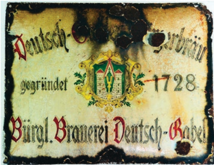
Obr. 1 Co znamená datum 1728 na reklamní smaltované ceduli jablonských právovárečnicků z počátku 20. století, se doposud nepodařilo vysvětlit

do pražského špinhausu. 44 Teprve tehdy byla smlouva mezi městskou radou Jablonného a hrabětem Franzem Josefem Pachtou podepsána (Hamburger, 1837, 155).