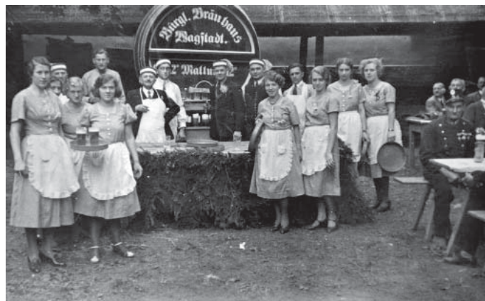
Obr. 2 Blíže neurčený výčep bíloveckého piva (Anonym, foto)

Dle Karla Franzla (Franzl, 1926) pracovalo k roku 1923 ve Slezsku 19 pivovarů a 11 sladoven. Z 11 sladoven bylo 5 čistě obchodních a 6 pivovarských. Mezi pivovarskými však autor neuvedl Bílovec. Sladovnický hvozď byl dominantní a zřejmě na většině pohlednic města, a proto by byla absence prvovýroby své suroviny zarážející. V pivovarských kalendářích byl seznam sladoven prvně uveden před první světovou válkou a Bílovec také nebyl uveden. Zarážející informací byla korespondence sládky Trenklera se sladovnou v Brodku, kde si sládek žádal informaci o ceně dvou vagónů sladu v roce 1914. Jak však bylo uvedeno výše v polovině 20. let 20.století, sladovna