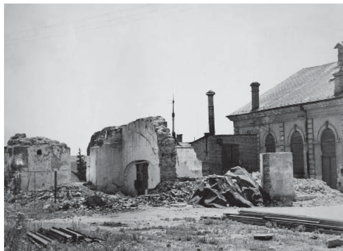
Obr. 5 Asanace sladovny pohledem ze Slezského náměstí v roce 1966