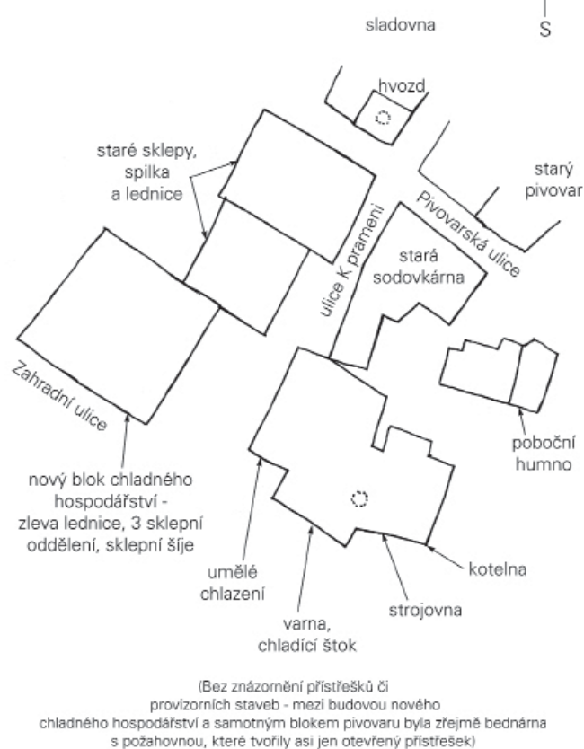
Obr.3 Orientační schéma rozmístění budov pivovaru a sladovny v Bílovci ve 40. letech 20. století (Starec, 2012)