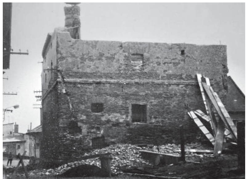
Obr. 4 Asanace sladovny pohledem ze Slezského náměstí v roce 1966 (SOKA, 397)

Nové moderní chladné hospodářství bylo vystavěno někdy po roce 1882 velmi velkoryse. Objekt se dochoval do dnešních dnů a především jeho výrazný jihovýchodní štít směrem do ulice Zahradní je zřetelný na mnoha pohledech starého i současného Bílovce. Celý komplex chladného hospodářství navazuje logicky na staré sklepy a je zahřouben v prudkém svahu tak, že z ulice Pivovarská jsou sklepy