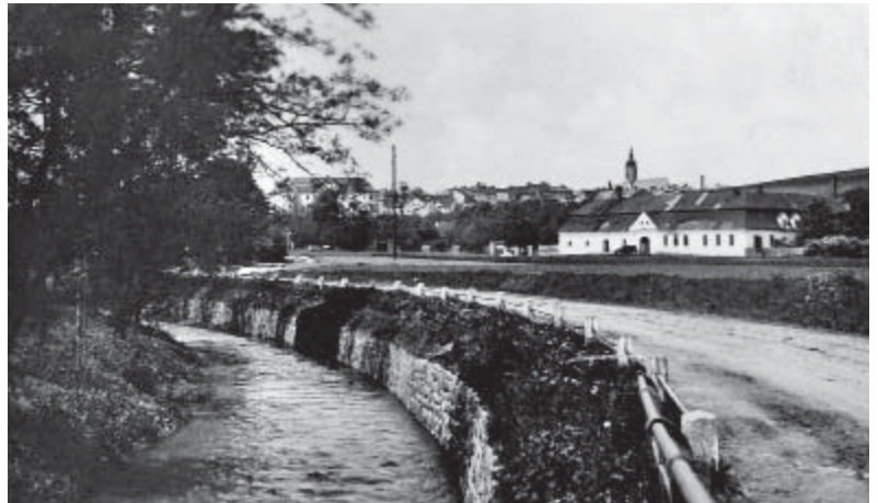
Obr. 6 Vrchnostenský velkoalbrechtický pivovar (Anonym, foto)

Plocha u albrechtického pivovaru sloužila před první světovou válkou jako vojenské cvičiště (Kuchta, 2006). V 30. letech 20. století došlo k přestavbě části pivovaru na hostinec. V průběhu druhé světové války budovy bývalého pivovaru plnily účel skladu vojenského materiálu Wehrmachtu. Po válce zde byl zřízen tzv. sběrný tábor, kde byli shromažďováni němečtí občané, kteří byli od března do října roku 1946 odsunuti v 7 transportech. Téhož roku vznikla myšlenka zřízení velké drubežárny v prostorách konfiskovaného velkoalbrechtického pivovaru. V objektu tak vznikl obří líhnařský a drubežářský podnik (Anonym, foto).