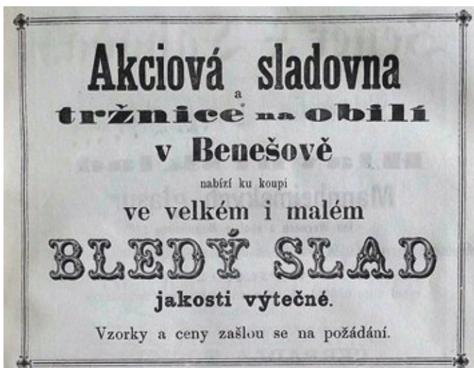
Obr. 2 Inzerát nabízející slad od Akciové sladovny v Benešově. Zdroj: Kvas II., č. 1, s. 19.

Podnik, založený v roce 1872 a zapsaný roku 1873 do Rejstříku společenských firem u Krajského soudu v Táboře (SOA Třeboň, 1863–1997a), který mj. aktivně nabízel slad prostřednictvím inzerce i oborových výstav v odborných kruzích (např. Anonym, 1874 obr. 2), vystupuje až do roku 1875 pouze jako „Akciová sladovna“ (např. Anonym, 1875). První akcie podniku, které již obsahují výraz „pivovar“, jsou dochovány až z roku 1877 (Píša, 2008), přestože existence společnosti pod tímto jménem je nesporně staršího data. Návrh valné hromady akciové společnosti o doplnění jména podniku o výraz „pivovar“ pochází ze dne 24. října 1875 (SOA Třeboň, 1863–1997b). Až do roku 1880 navíc neznáme výstav pivovaru (Likovský, 2005). Jisté je, že někdy mezi lety 1877–1880 již stojí v Benešově parostrojně zařízený pivovar („Dampfbierbrauerei“ – srov. např. III. vojenské mapování, 1877–1880). Kdy však byl s jistotou založen a jakou roli v jeho fungování hrály osobnosti, které dosavadní literatura uvádí jako jeho sládky (Likovský, 2010) již od roku 1873, není jasné a odpovědi může přinést až další výzkum.