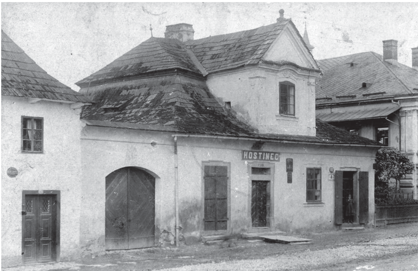
Tradiční hostinec „U Příhodů“ v Chocni čp. 146, foto z roku 1917

u Chocně se dne 15. srpna nečepovalo žádné pivo a nebyla k máni ani sodovka! Pila se jen voda a vyhrával flašinet - smutný to obrázek (SOKa Ústí nad Orlicí, AMCH, 1914–1916, 326).