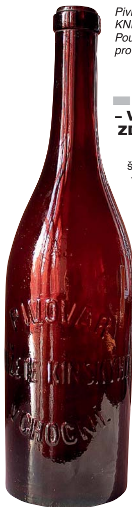
Pivní litrová láhev s nápisem PIVOVAR KNÍŽECÍ V CHOCNI. Používaná během 1. světové války pro choceňské pivo

Vedle problémů se zásobováním zachvátil Choceň i velký oheň. Dne 8. prosince 1915 hořel tzv. Horní mlýn na Podskalí a tento požár představoval pro nedaleko stojící knížecí pivovar velké nebezpečí. Západní vítr totiž odnášel hořící oharky a mraky jisker přes široké řečiště Orlice přímo na pivovarský dvůr. Tato živelná pohroma našťastí nepůsobila na pivovarských budovách žádných viditelných stop (SOKA Ústí nad Orlicí, AMCH, 1914–1916, 216).