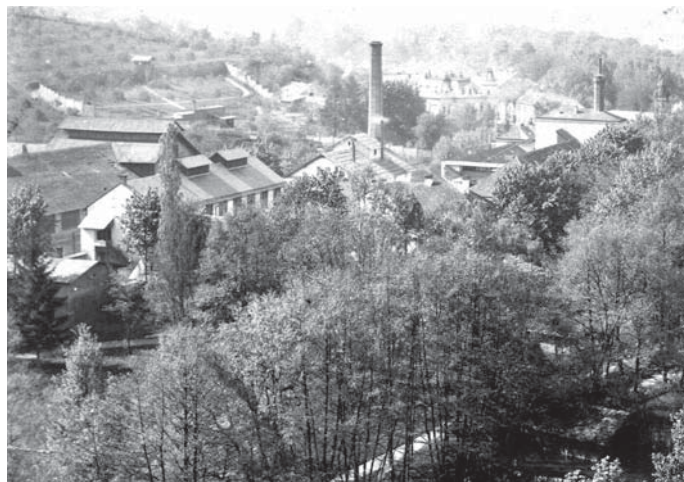
Pohled na choceňský pivovar v období první světové války.

Za vojáky do Chocně se sjížděli příbuzní, takže všechny hostince byly brzy přeplněny k prasknutí. V Chocni si mohli koupit alespoň pivo. Zdejší pivovar byl z právě skončené velké výstavní akce dobře zásoben. To v nedalekém Vysokém Mýtě bylo piva už nedostatek a dováželo se tam z okolních pivovarů. Živnostensko-průmyslová a hospodářská výstava v Chocni se konala od 27. června do 27. července 1914. V knížecím parku v Pelinách a v prostorách pivovaru byl vytvořen průmyslový výstavní pavilon. Na výstavišti byla zbudována speciální pivovarská restaurace, kde se čepovalo choceňské pivo. O úspěšnosti výstavy svědčí i mimořádný počet více jak 84 000 návštěvníků ze všech koutů habsburské monarchie. Vrchní sládek knížecího pivovaru František Satran se stal i členem čestného výboru živnostenské výstavy (Katalog ŽHV, 1914, 21).