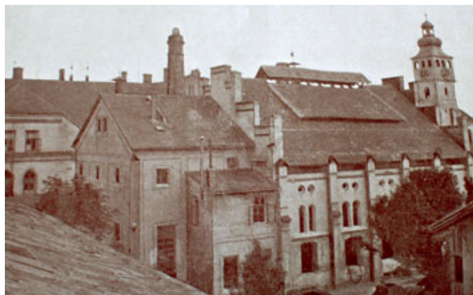
Obr. 3 Dobový pohled na dnes už nestojící část starého novobydžovského pivovaru. (Repro z knihy Honza, J.: O pivovarství v král. věn. městě Novém Bydžově, nečíslovaná strana)

„Nelze pochybovat o tom, že zájmy právovárečného měšťanstva jsou velmi citelně dotčeny, když ani podílíci, kteří v místě provozují hostinskou živnost, nečepují pivo vlastního pivovaru, nýbrž může se přirozeně týkati jen majitelů právovárečných domů, kde se provozuje živnost hostinská (výčepnická), vztahuje se však zásadně na všechny takové podílíky a nelze proto mluvit o nerovnosti mezi členy, z níž dovolání dále vyvozuje neplatnost dotčeného předpisu stanov. Pokud dovolatelé s tohoto hlediska namítají, že důsledky zákazu čepovati cizí pivo stíhají jen několik málo členů společnosti, provozují-