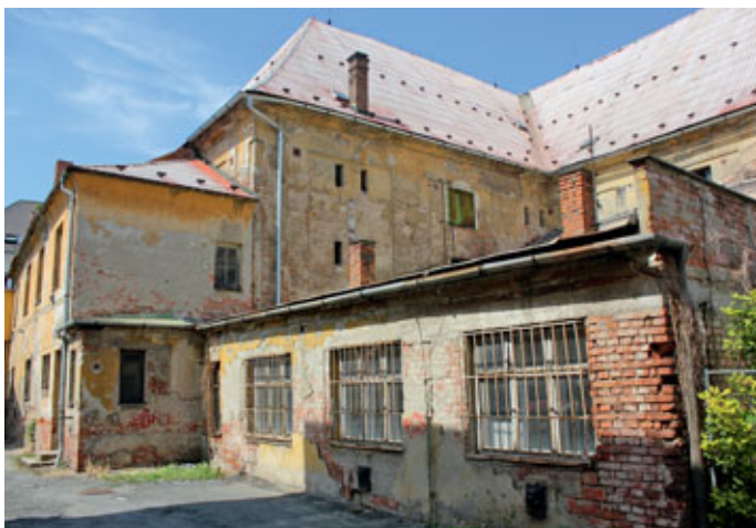
Obr. 2 Pohled na areál starého olomouckého měšťanského pivovaru (Foto autor: 2017)

bem logicky vyplývala už z práva mílového, které dostalo město od Rudolfa I. Habsburského v roce 1278. Právovárečné měšťanstvo doložilo soudu i privilegium Vladislava Jagellonského z roku 1510 obsahující zákaz výčepu jiných než olomouckých piv v okruhu jedné míle.