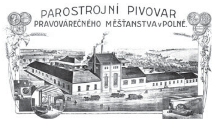
Obr. 5 Dobový pohled na areál právovárečného pivovaru v Polné.

uznal za vhodné. Valná hromada byla usnášenischopná, pokud se na ni dostavilo 60 právovárečníků. Právovárečníci se na valné hromadě mohli zastupovat navzájem, ale takto mohli hlasovat vždy jen za jednoho kolegu. Platnosti nabývaly návrhy absolutní, volilo se většinou hlasů. Předseda hlasoval jen při rovnosti ostatních hlasů. Jmění spolku obstarával správní výbor, který zastupoval firmu navenek. Byl tvořen 13 členy, přičemž všichni z nich museli být z Poličky. Výbor se volil valnou hromadou na tři roky. Scházel se minimálně jednou za čtvrt roku. Stanovy dávaly pravidla i pro rozhodčí soud. Každá ze sporných stran volila dva důvěrníky z řad spolku a tyto pak pátého právovárečnicka. Rozhodnutí tohoto vnitřního orgánu mělo být pro všechny závazné.