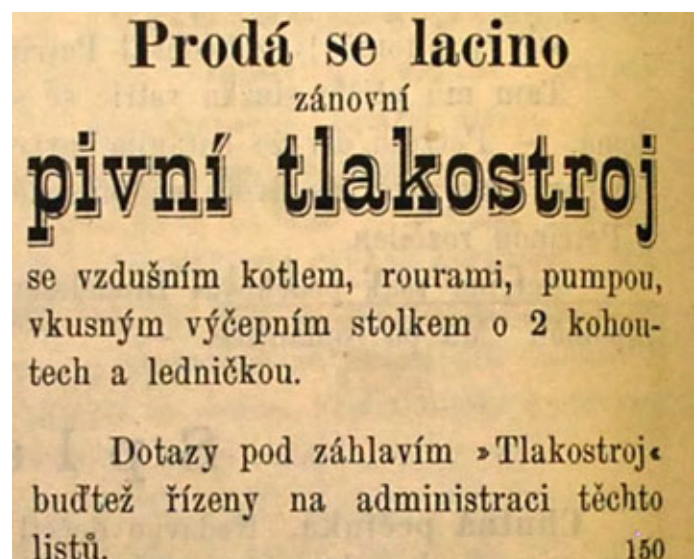
Obr. 4 Dobový inzerát na pivní tlakostroje. (Kvas 1880, VIII, s. 156)

Právo-várečníci v Poličce měli stanovy od roku 1876. Vrcholným orgánem byla valná hromada a od ní zvolený výbor. Valná hromada se svolávala nejméně dvakrát ročně, konkrétně každou třetí neděli v květnu a třetí neděli v listopadu, protože správní rok končil koncem října. Mimořádnou valnou hromadu navíc mohli svolat libovolných 35 právo-várečníků, tedy zhruba třetina celkového počtu 113. Mimořádnou valnou hromadu také mohli svolat zvolený výbor, pokud to