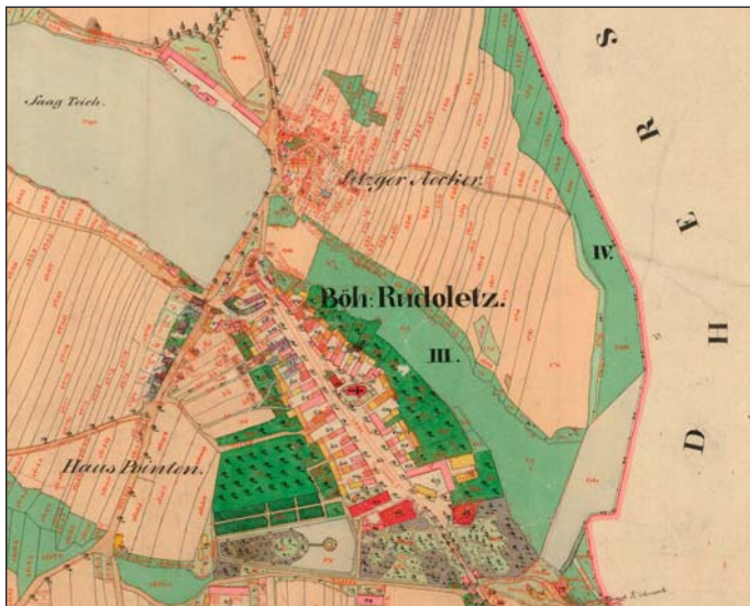
Obr. 2 Mapa císařského otisků stabilního katastru Českého Rudolce z roku 1836 s vyznačeným dokresleným objektem č. p. 2 (www.archivnimapy.cz, mapový list 0395-1-04)

V tropických oblastech s vysokými teplotami bylo v té době pivo luxusním zbožím, protože zde díky podnebí nemohly být vystaveny žádné pivovary. Pivo si zde mohly dovolit jen elity a závodná voda byla častým zdrojem nemocí. Při užití Getreidesteinu bylo možné vyrábět i přímo na místě pivo obzvláště kvalitní, a to za nižších nákladů