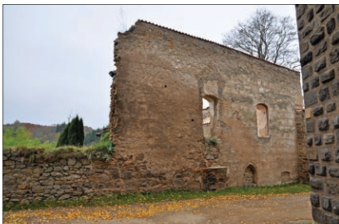
Obr. 3 Hrad Zvíkov, okres Písek, severovýchodní průčelí pivovaru

Plocha celé jižní části pivovaru neobsahuje žádné viditelné pozůstatky dalších stavebních konstrukcí. Jedinou anomálií představuje mírné zvýšení terénu podél jihovýchodní zdi.