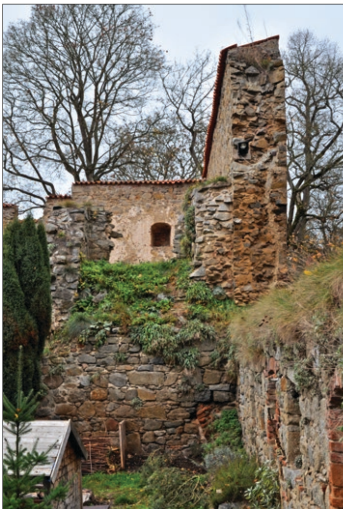
Obr. 5 Hrad Zvíkov, okres Písek, dochovaný úsek zdi, dělící objekt pivovaru na dvě poloviny a výběh staršího cihlového klenebního pasu (Foto autor 2014)