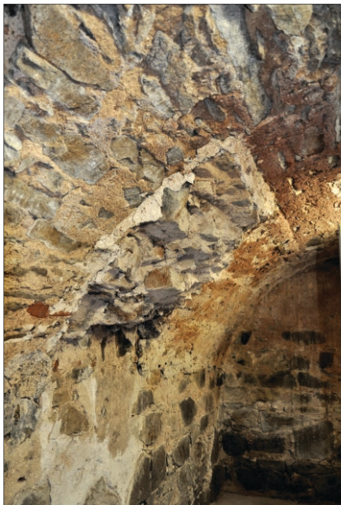
Obr. 7 Hrad Zvíkov, okres Písek, úsek staršího zdiva, procházejícího valenou klenbou skřípku (Foto autor 2015)

K navazujícímu, stejně vysokému úseku severozápadní zdi o délce asi 7 m se připojuje asi 3 m dlouhý úsek poněkud nižší, zjevně mladší zdi ze smíšeného zdiva, směřující rovnoběžně s podélnou osou objektu. Nad její korunou, vysoko nad úrovní někdejší podlahy patra, se otvírá nevelký, segmentově završený výklenek. Jde zřejmě