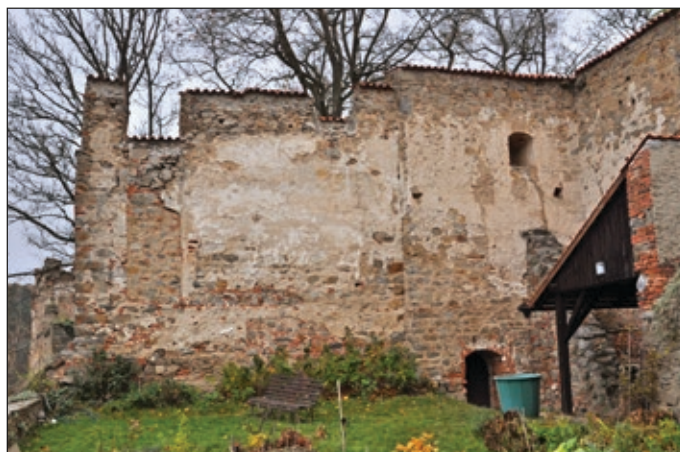
Obr. 8 Hrad Zvíkov, okres Písek, severozápadní zeď pivovaru od jihu, napravo vyšší zdívo části starší budovy, vlevo zbytky pravděpodobně renesanční dostavby

S největší pravděpodobností bylo také rozšíření druhé brány od jihu v 16. století (Varhaník, 2015, s. 417–418) vyvoláno potřebou snazší dopravy panského piva z hradního pivovaru, stejně jako úpra-