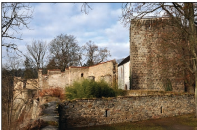
Obr. 2 Hrad Zvíkov, okres Písek, pohled na objekt pivovaru od jihu, vpravo v pozadí Hlízová věž

Plocha celé jižní části pivovaru neobsahuje žádné viditelné pozůstatky dalších stavebních konstrukcí. Jedinou anomálií představuje mírné zvýšení terénu podél jihovýchodní zdi.