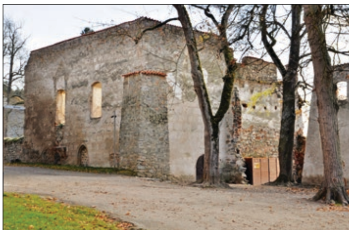
Obr. 4 Hrad Zvíkov, okres Písek, pohled na pivovar od severu, v popředí nároží starší budovy, s pozdějším opěrákem (Foto autor 2015)

dušší je jižní část, vymezená na jihozápadě úsekem obvodní hradby o výšce něco přes 2 m nad vnitřní úroveň terénu. Vnitřní líc hradby nese stopy četných druhotných zásahů a obsahuje cihelné vysprávk. Na hradbu navazuje jihovýchodní zeď pivovaru z vrstveného lomového kamene o shodné výšce, otvírající se navenek dvojicí štěrbinových okének s ostěním z hrubě opracovaných kamenných bloků s dovnitř se rozšiřujícími špaletami. (obr. 2) Pod východním okénkem vyčnívá nad úrovní terénu vrchol širšího segmentového cihlového záklenku. Východní nároží je vyzděno z lomového kamene. Navazující severovýchodní zeď obsahuje trojici štěrbinových okének obdobných jako předchozí, s nimiž se pravidelně střídají dvě odlišně uspořádaná nevelká oboustranně špaletovaná okénka se segmentovými