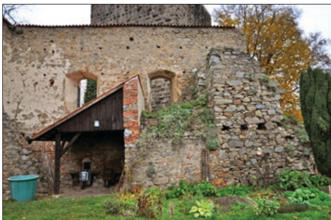
Obr. 6 Hrad Zvíkov, okres Písek, vestavba do severní části objektu s valeně klenutým interiérem

severovýchodní zdi severní části pivovaru se zbytky bíle nalíčené omítky se v úrovni patra otvírají dovnitř se rozevírající špalety velkých oken se střežovitými záklenky z lomových, naostro kladených kamenů. Severní okno je opatřeno dvojicí sedátek. Interiér obsahoval v patře velký sál, osvětlený od severovýchodu dvojicí velkých oken a tak vysoký, že po jeho stropu není na dochované úrovni zdiva stop. (Varhaník 2015, 415).