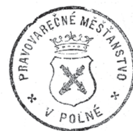
Obr. 6 Razítko pivovaru v Polně.

V případě nešlo jen o daně ale o znovuprokázání svébytnosti právovárečných měšťanstev. Paralelně probíhal soudní spor, který nakonec dospěl až k c.k. správním dvoru soudnímu do Vídně, kam se obrátila právovárečná měšťanstva v Trutnově, Strakonících a Mělníce. Na místě byli i zástupci Mirovic u Pisku a jednatel Spolku pro průmysl pivovarský Fran-