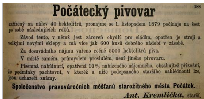
Obr. 5 Dobový inzerát na pronájem pivovaru v Počátkách. (Zdroj: Kvas, 1879, VI, s. 145)

Zdanění mělnického právovárečného měšťanstva soudy odvozovaly ze stanov. Argumentovaly mj. tím, že cílem sdružení je docílit zisku a tím se stalo subjektem berním na základě spolkového zákona. Pivovar ale argumentoval, že má základ v nejstarších českých privilegích, konkrétně české královny Alžběty vydané v roce 1382. Stanovy právovárečného měšťanstva se prý ze zákona vymykaly, protože údajně šlo o jakýsi domácí řád nesprávně stanovami nazvaný, který nebyl schválený žádným úřadem (Anonym, 1904e, s. 67). Některá právovárečná