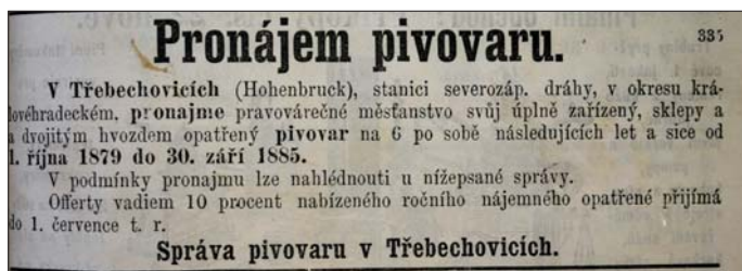
Obr. 4 Dobový inzerát na pronájem pivovaru v Třebechovicích.